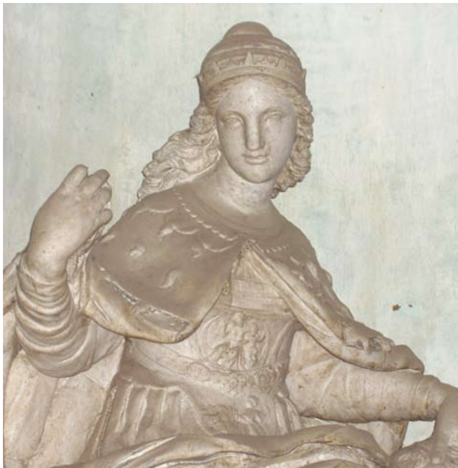
« la république de Venise » (escalier monumental - Fondation Cini – San Giorgio Maggiore)